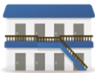
ふたば荘、たんぽぽ つくしんぼ、すみれ 定員6名