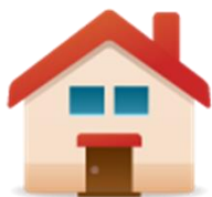
セカンドフタバ 定員5名

ステップ、くれよん、コスモス ひまわり、アルファ、ホップ アルファ、パークフタバ